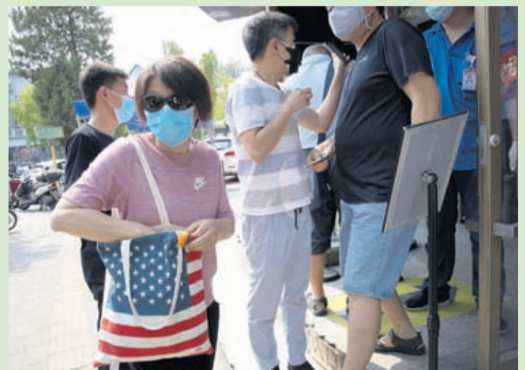
A resident wearing mask to curb the spread of the coronavirus carries a United States flag shopping bag in Beijing on Wednesday, July 8, 2020.

Barr also accused hackers linked to the Chinese government of targeting American universities and businesses to steal research related to coronavirus vaccine development, leveling the al-